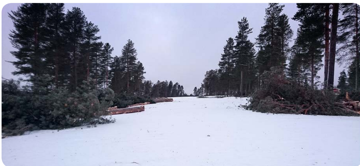
Hål 1 på Björnen.

I årets första nyhetsbrev berättar vi om allt som är på gång i klubben. 2017 tar vi ännu ett steg framåt för att göra din golfupplevelse riktigt trevlig.